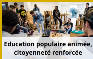
Education populaire animée, citoyenneté renforcée