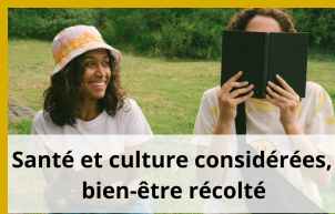
Santé et culture considérées, bien-être récolté