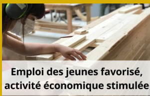
Emploi des jeunes favorisé, activité économique stimulée