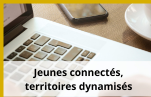
Jeunes connectés, territoires dynamisés