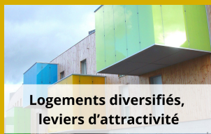
Logements diversifiés, leviers d'attractivité