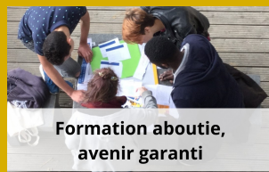
Formation aboutie, avenir garanti