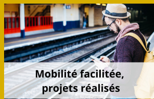
Mobilité facilitée, projets réalisés

Union régionale pour l'habitat des jeunes